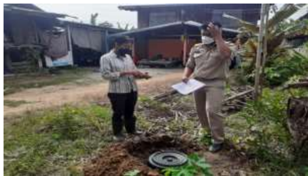
ภาพที่ ๖ กิจกรรมอบรมให้ความรู้ประชาชน ขับเคลื่อนโดยอาสาสมัครท้องถิ่นรักษ์โลก (อถล.)

๓. การสร้างความรู้ ความเข้าใจให้กับประชาชน ได้เข้าใจหลักการจัดการขยะมูลฝอยชุมชน แหล่งกำเนิดตามหลัก ๓Rs (Reduce Reuse และ Recycle ) หรือหลัก ๓ ข. “ใช้น้อย ใช้ซ้ำ และ นำกลับมาใช้ใหม่ โดยการจัดอบรมแกนนำอาสาสมัครท้องถิ่นรักษ์โลก (อถล.) เพื่อนำความรู้ที่ได้รับ ไปถ่ายทอดให้กับประชาชนในหมู่บ้าน/ชุมชน โดยการเดินรณรงค์เคาะประตูบ้านทุกหลังคาเรือน และทำหนังสือขอความร่วมมือหน่วยงานส่วนราชการที่เกี่ยวข้องในเขตรับผิดชอบได้รับทราบ และมีความรู้ ความเข้าใจที่ถูกต้อง