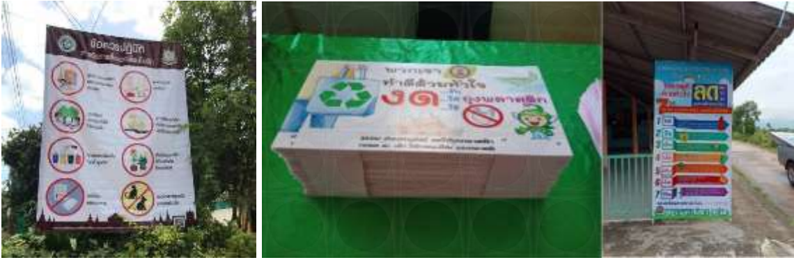
ภาพที่ ๕ การประกาศนโยบาย และข้อตกลงความร่วมมือ ระดับตำบล

๓. การสร้างความรู้ ความเข้าใจให้กับประชาชน ได้เข้าใจหลักการจัดการขยะมูลฝอยชุมชน แหล่งกำเนิดตามหลัก ๓Rs (Reduce Reuse และ Recycle ) หรือหลัก ๓ ข. “ใช้น้อย ใช้ซ้ำ และ นำกลับมาใช้ใหม่ โดยการจัดอบรมแกนนำอาสาสมัครท้องถิ่นรักษ์โลก (อถล.) เพื่อนำความรู้ที่ได้รับ ไปถ่ายทอดให้กับประชาชนในหมู่บ้าน/ชุมชน โดยการเดินรณรงค์เคาะประตูบ้านทุกหลังคาเรือน และทำหนังสือขอความร่วมมือหน่วยงานส่วนราชการที่เกี่ยวข้องในเขตรับผิดชอบได้รับทราบ และมีความรู้ ความเข้าใจที่ถูกต้อง