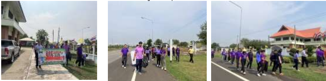
ภาพที่ ๘ รมรงค์ส่งเสริมให้มีรมรงค์ทำความสะอาดพื้นที่สาธารณะทุกเดือน ( big cleaning day)

๕. การส่งเสริมให้หมู่บ้าน/ชุมชนมีการดำเนินงานตามแผนงานกิจกรรมอย่างต่อเนื่อง เช่น รมรงค์ทำความสะอาดพื้นที่สาธารณะทุกเดือน กิจกรรมคัดแยกขยะมูลฝอย ๓Rs อย่างต่อเนื่อง กิจกรรมจัดทำถังเปียกลดโลกร้อน และการจัดทำธนาคารขยะหมู่บ้าน/ชุมชน เป็นต้น