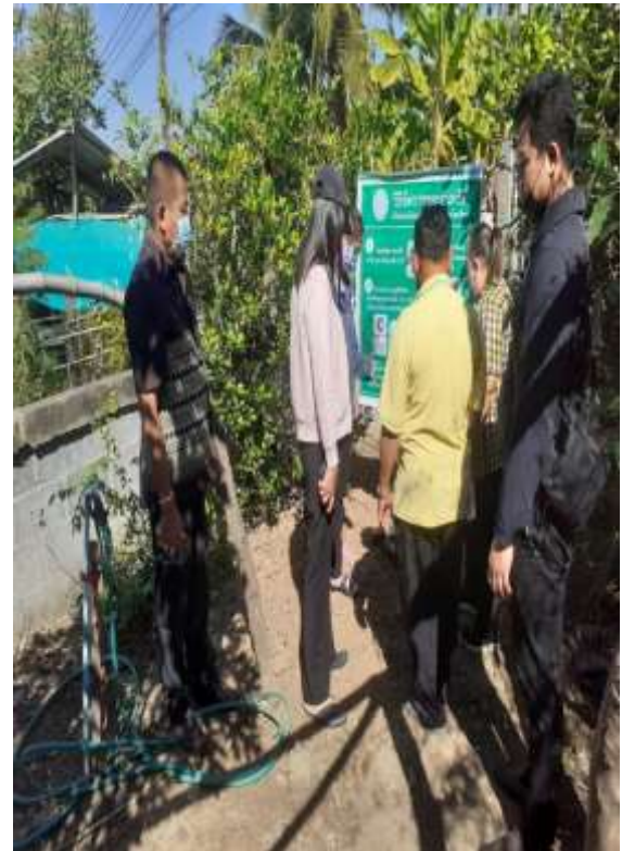
ภาพที่ ๗ กิจกรรมแกนนำ อาสาสมัครท้องถิ่นรักษ์โลก อถล.เดินรณรงค์ให้ความรู้ เคาะประตูบ้าน