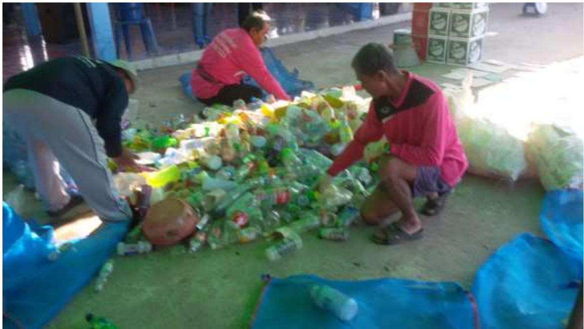
ภาพที่ ๑๑ กิจกรรมส่งเสริมการคัดแยกขยะรีไซเคิล และจัดตั้งธนาคารขยะหมู่บ้าน/ชุมชน