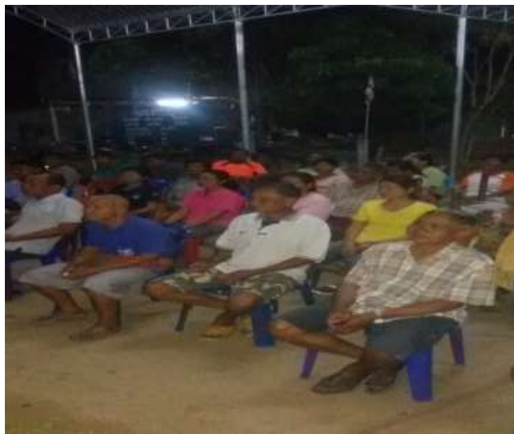
ภาพที่ ๒ การจัดประชุมสะท้อนข้อมูลให้ชุมชน และรับฟังความคิดเห็นการดำเนินงานธนาคารขยะ (Recyclable Waste Bank) โดยจัดทำเป็นธรรมนูญชุมชน/หมู่บ้าน เพื่อส่งเสริมการคัดแยกขยะที่ต้นทาง