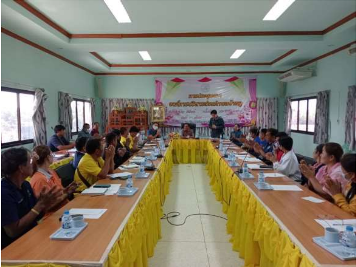
ภาพที่ ๖ การจัดทำบันทึกข้อตกลง กับภาคีเครือข่ายที่เกี่ยวข้อง ระดับตำบล