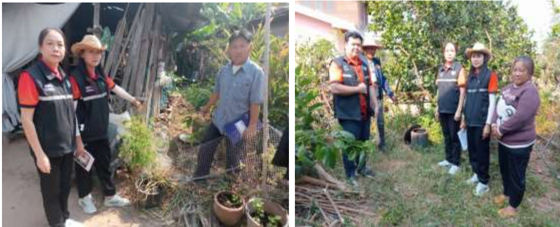
ภาพที่ ๑๐ กิจกรรม จัดทำถังเปียกลดโลกร้อน