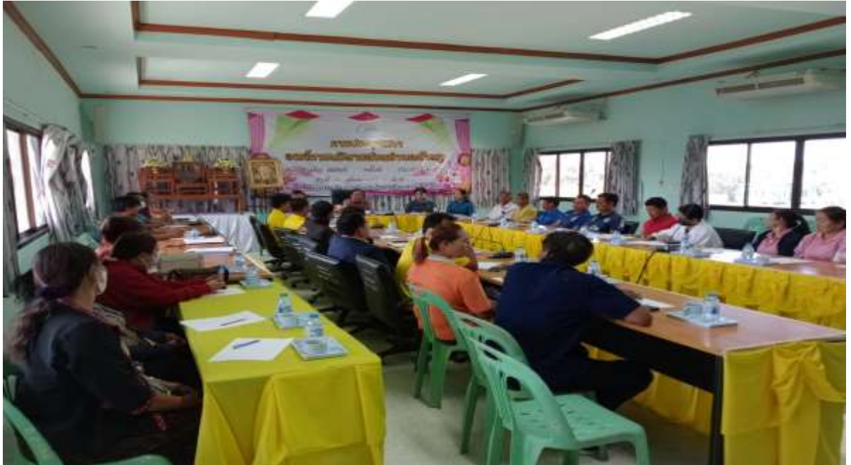
ภาพที่ ๑๒ การประชุมติดตามผลการดำเนินงาน