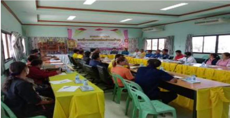
ภาพที่ ๕ แต่งตั้งคณะทำงานจัดเตรียมข้อมูลสำหรับการทวนสอบรับรอง ปริมาณก๊าซเรือนกระจก รอบที่ ๓ (โครงการถังเปียกลดโลกร้อน)