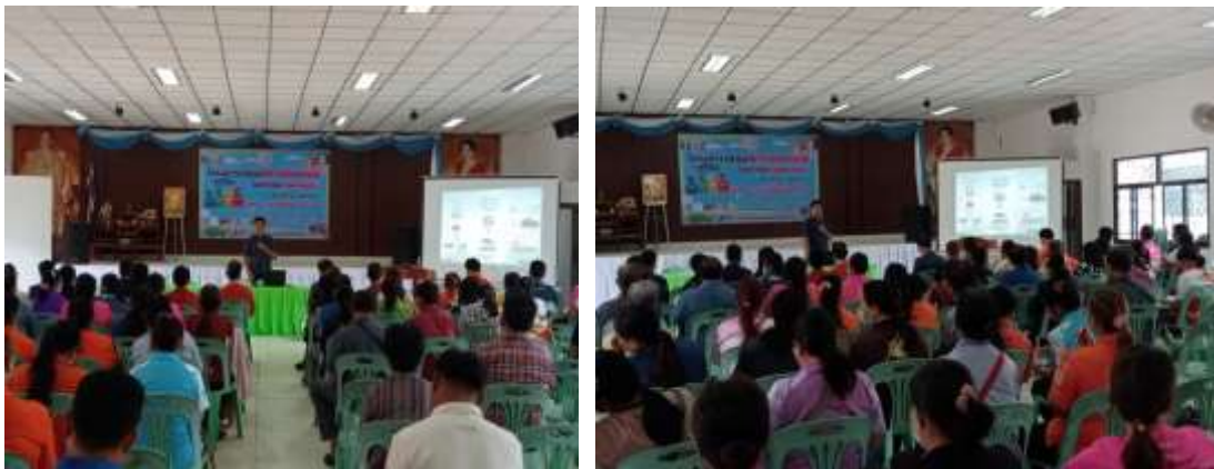
ภาพที่ ๙ กิจกรรม รมรงค์ส่งเสริมให้มีการคัดแยกและกำจัดขยะที่ต้นทาง