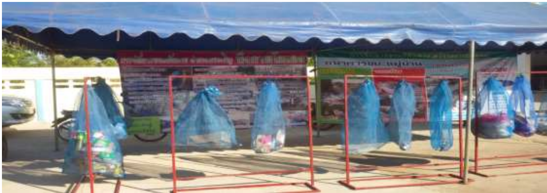
ภาพที่ ๑ การสำรวจข้อมูลขยะมูลฝอยระดับครัวเรือน การจัดการขยะมูลฝอย การคัดแยกขยะมูลฝอย และขยะรีไซเคิลในพื้นที่

๑. การเตรียมความพร้อม เรื่องการบริหารจัดการขยะมูลฝอยชุมชน จากแหล่งกำเนิด ตามหลัก ๓Rs (Reduce Reuse และ Recycle ) หรือ หลัก ๓ ข. “ใช้น้อย ใช้ซ้ำ และนำกลับมาใช้ใหม่” โดยการสำรวจข้อมูลขยะมูลฝอยระดับครัวเรือน การจัดการขยะมูลฝอย การคัดแยกขยะมูลฝอย และขยะรีไซเคิลในพื้นที่ พร้อมทั้งจัดทำฐานข้อมูล โดยอาสาสมัครท้องถิ่นรักษ์โลก (อถล.) รวมถึงการจัดประชุมสะท้อนข้อมูลให้ชุมชน และรับฟังความคิดเห็นการดำเนินงานธนาคารขยะ(Recyclable Waste Bank) โดยจัดทำเป็นธรรมนูญชุมชน/หมู่บ้าน เพื่อส่งเสริมการคัดแยกขยะที่ต้นทาง