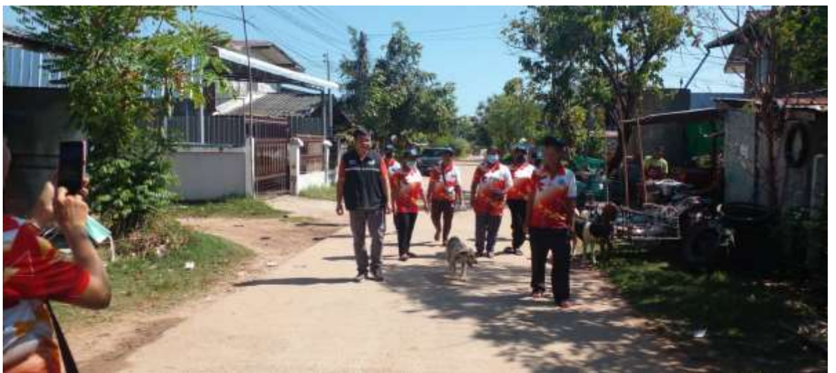
ภาพที่ ๑๓ การออกติดตามประเมินผลการดำเนินงาน โดยคณะกรรมการ และประชาชนที่ไม่ใช่คณะกรรมการ